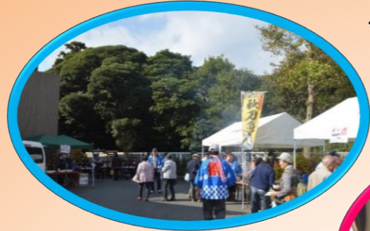
焼きさんま、豚汁無料配布