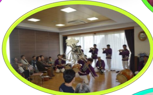
イベントホール 鳴り物(紫友会)