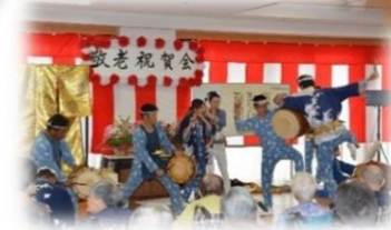
鳴り物 四日市清流会