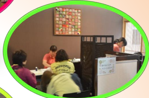
リラクゼーション(ハンド&ツボ)