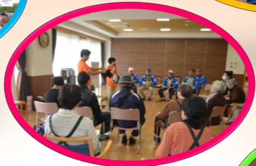
イベントホール プラチナ体操