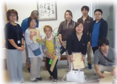
9月24日(火) 稲敷市 特別養護老人ホーム 宝永館の職員の方々 が施設見学に訪れました。