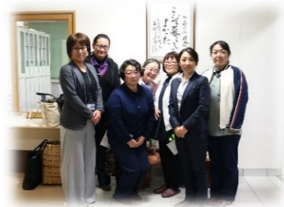
12月17日(月) 横芝光町 特別養護老人ホーム 吉祥苑の職員の方々 と交流勉強会を行いました。