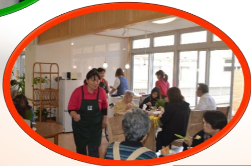
喫茶まりっこ 手作りシフォンケーキ