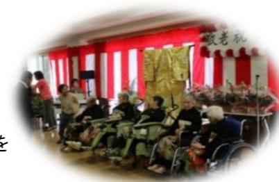
津軽三味線 ドリーム会

9月16日 今年も盛大に敬老祝賀会を行いました。 留袖を着た100歳以上3名と白寿2名の入居者を筆頭に、たくさんのご家族様と共に祝いを行いました。