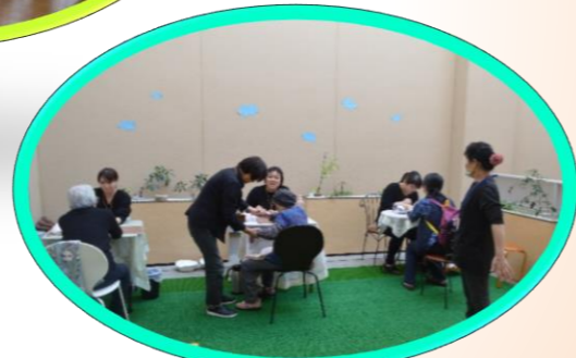
リラクゼーション(ハンド&ネイル)