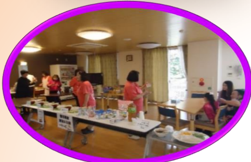
給食形態展示/手洗い診断